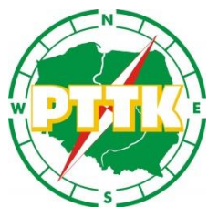
PTTK Oddział Rzeszów