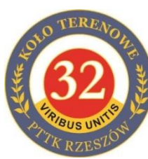
Koło Terenowe 32